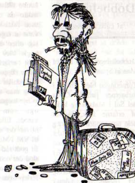
Tegning af Claus Q. Jessen