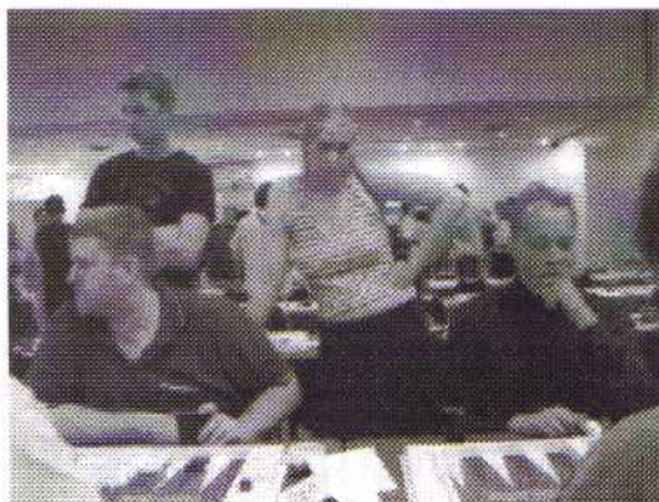
Nogle af de danske spillere.

siden på, at to hollændere (Evert van Eyck og den senere Nordie Open vinder Rolf Schreuer) aftalte at den ene skulle vinde fordi de havde hans anpart i auktionen.